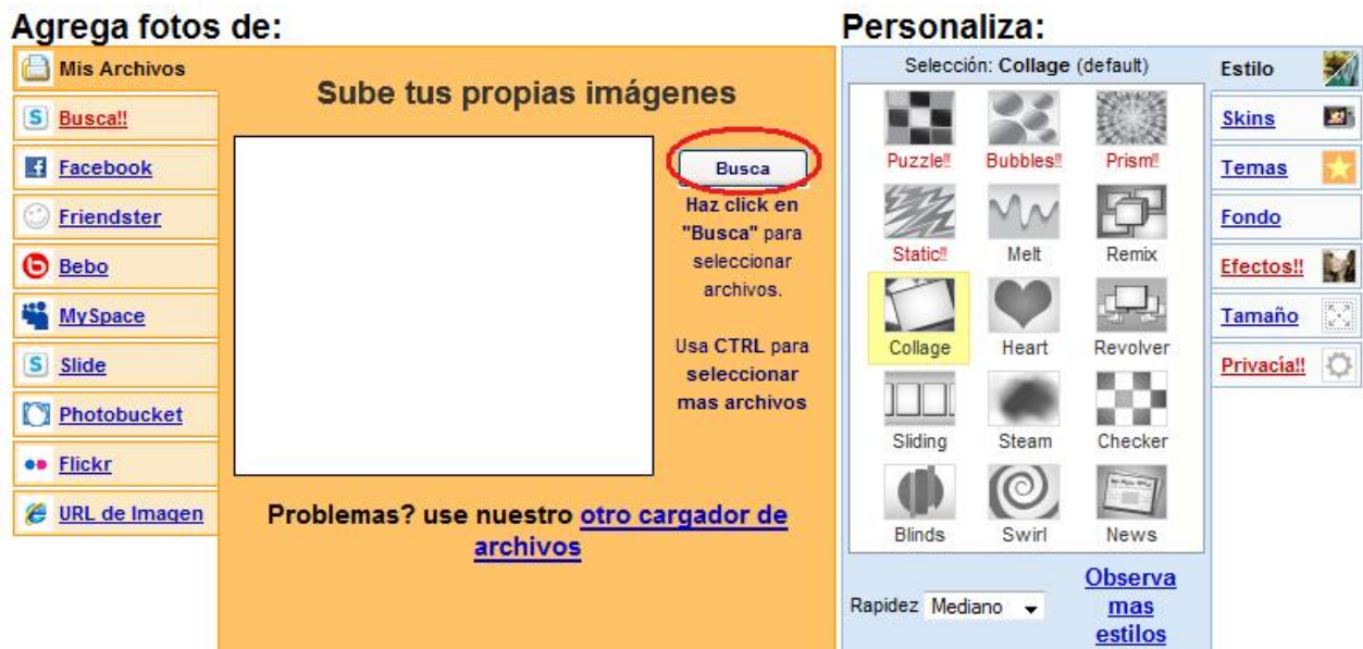
Figura 4. Ventana para buscar los archivos.

Aunque se pueden subir tantas fotos como se deseen, se recuerda que lo importante no es la cantidad, sino que sean las fotos necesarias para narrar un suceso. Además, demasiadas fotos de lo mismo hace que se pierda rápidamente el interés sobre la presentación.