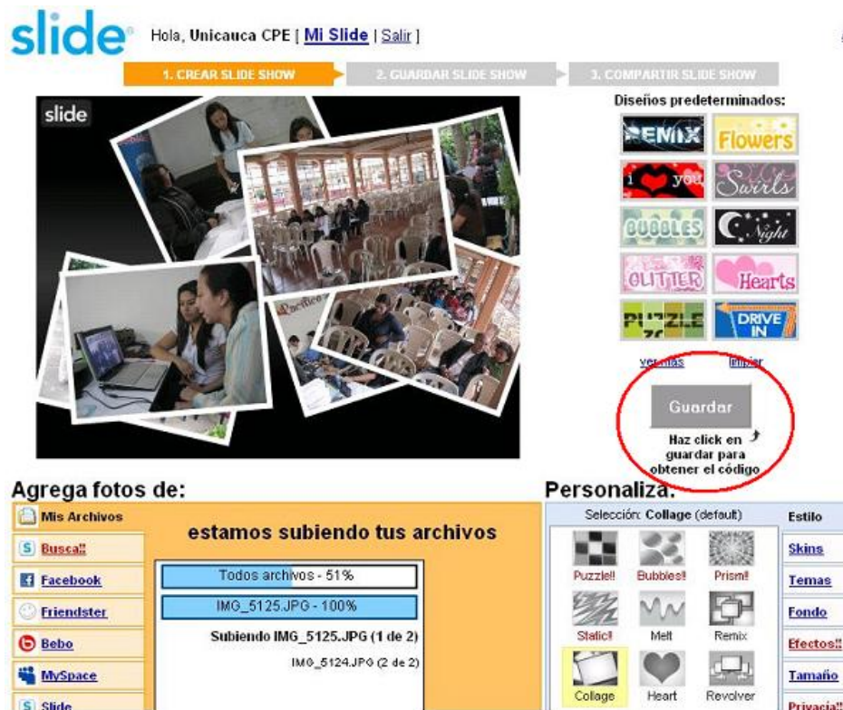
Figura 5. Crear Slide show - Subiendo fotografías. Visualización Estilo Collage.

Mínimamente hay que elegir el Estilo antes de Guardar. Lo que se elige se ve inmediatamente en el Panel, pudiendo decidir qué poner o quitar. Además en la parte inferior de las opciones “Personaliza” está la opción Rapidez, para elegir la velocidad de