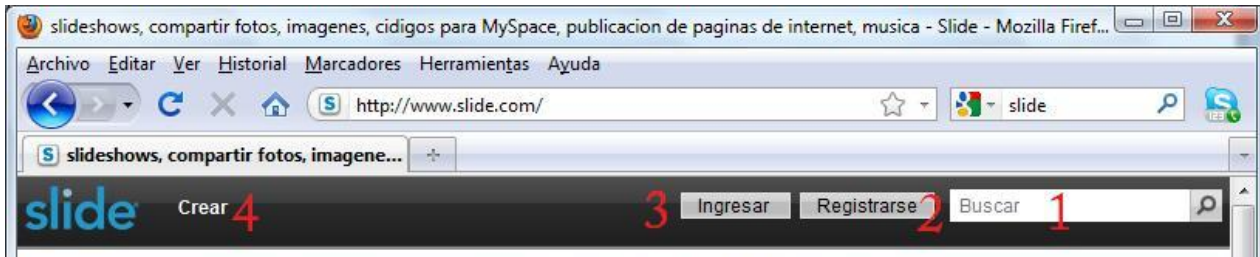
Figura 2. Interfaz web de Slide.com parte superior

Para iniciar, vamos a registrarnos entrando en la opción 2 que muestra la Figura 2. Una vez se ingrese se desplegará un formulario, donde debe registrar un nombre, un correo electrónico y una contraseña. Diligencie los datos correctamente y recuérdelos, pues luego deberá usarlos para ingresar a su cuenta. Una vez llene el formulario y elija “Registrarse”, se abrirá esta página: