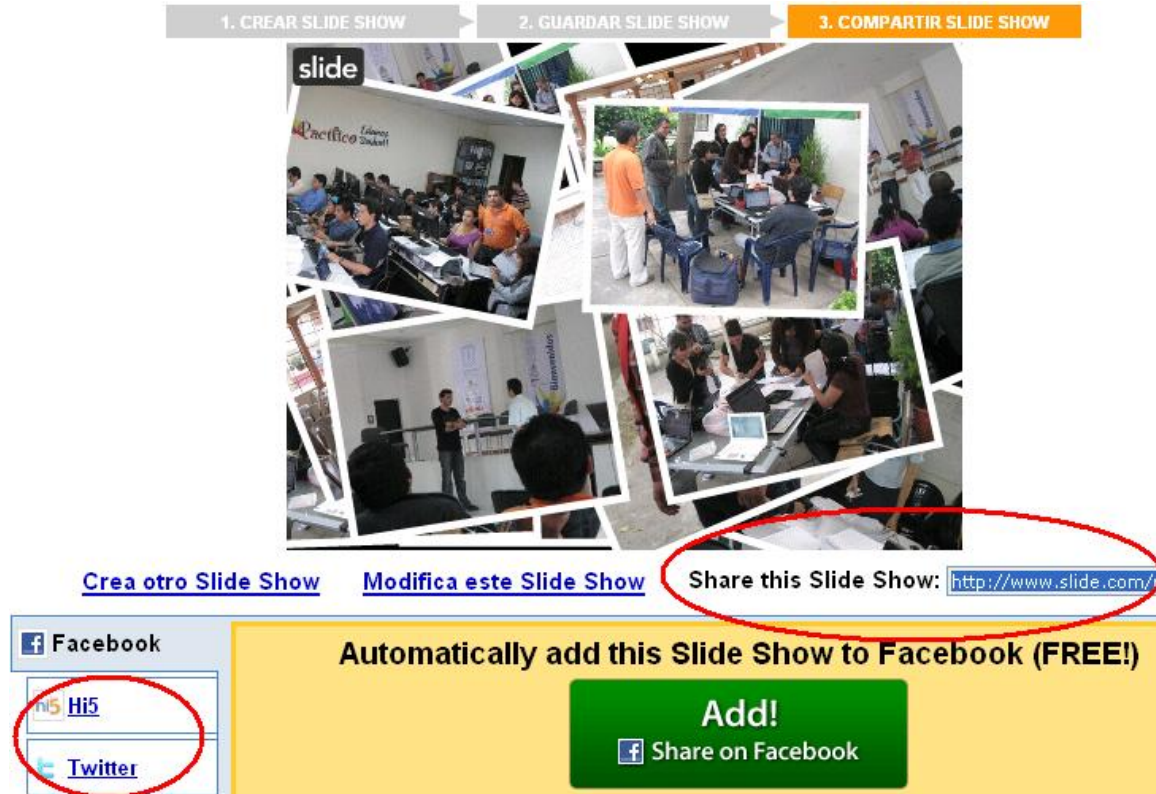
Figura 8. Compartir Slide show

Regrese a las opciones generales de la cuenta (Ver Figura 3 o 13) a través de Mi Slide, donde podrá tener acceso de nuevo a todas las funciones y al historial de lo publicado.