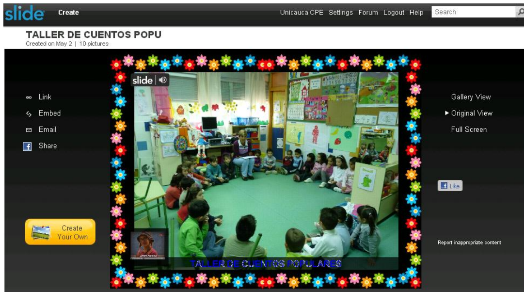
Figura 1. Presentación “Taller de cuentos populares” que registra actividad escolar.

Slide es un servicio web creado bajo la idea de construir comunidades que fomenten la creación y distribución de productos virtuales, donde los usuarios puedan divertirse a la vez que tienen la posibilidad de gozar de los beneficios de participar en redes sociales. Para ello ofrecen varios aplicaciones interactivas que apuntan a generar experiencias a través de las cuales se encuentran y generan comunidades de usuarios. Uno de sus servicios es la posibilidad de crear muy fácilmente presentaciones de fotos o imágenes de forma dinámica y secuencial, agregándoles efectos y elementos que las enriquecen para compartirlas en línea.