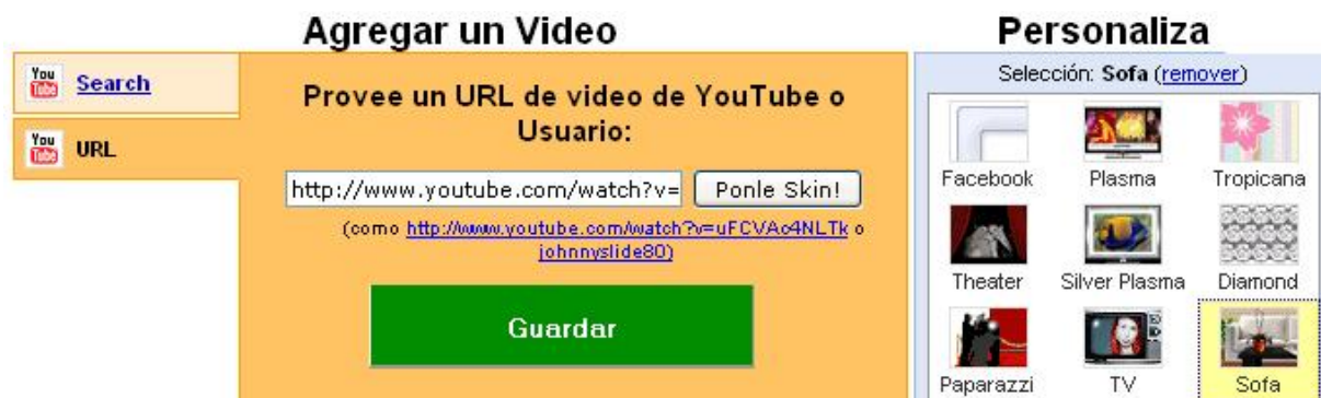
Figura 11. Agregar un video de YouTube con opción ingresar URL

Una vez se elige la opción “Busca”, se listarán los resultados. Se da clic sobre el que se desea. La otra posibilidad es ingresar la dirección URL directamente: