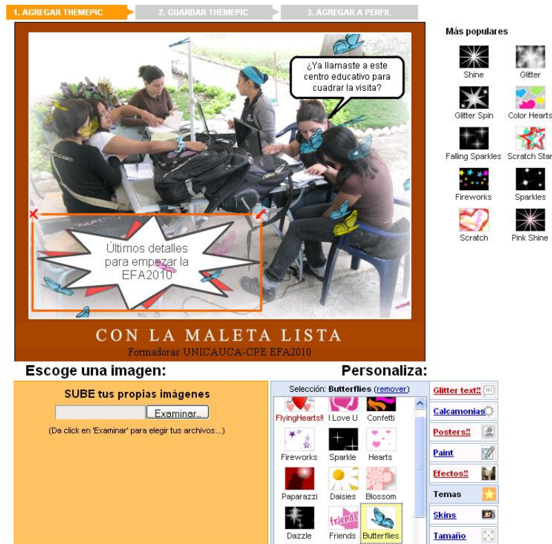
Figura 9. Opciones de FunPix en Slide