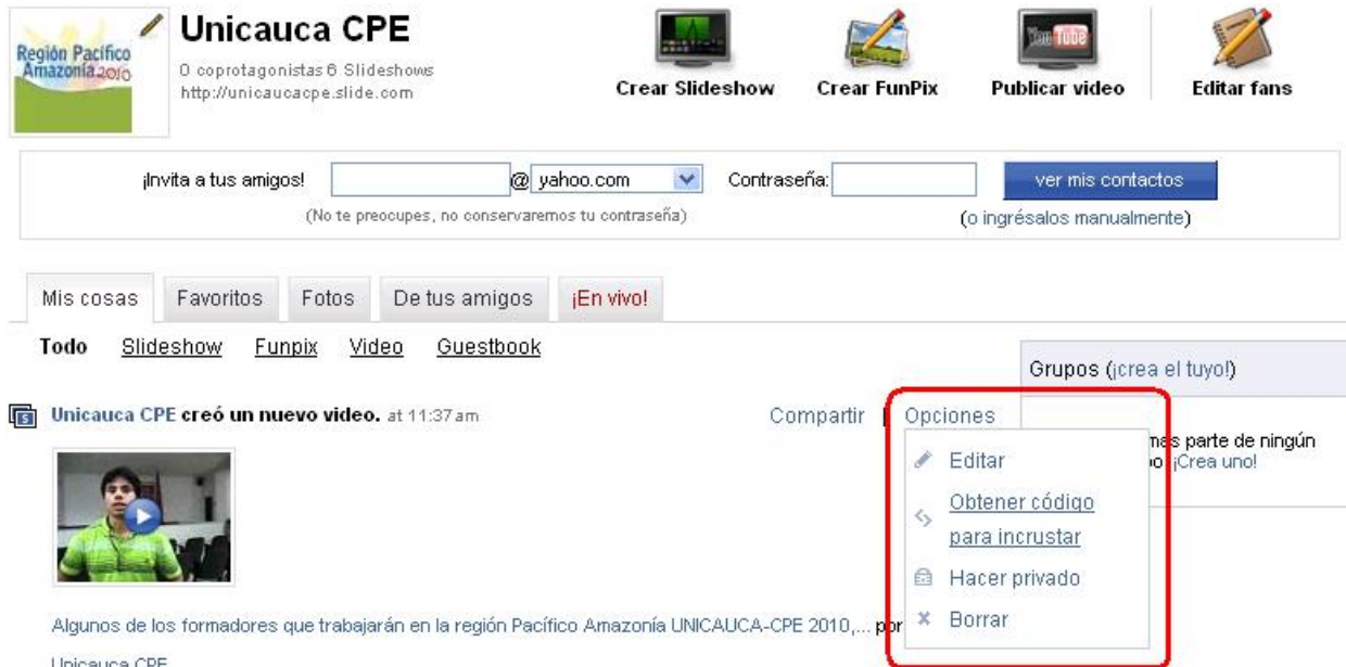
Figura 13. Opciones adicionales para administrar lo subido en Slide

Cuando se regresa a Mi Slide, puede actuar sobre lo que ha publicado desde dos enlaces: Compartir, desde donde se abre un formulario para mandar un mensaje electrónico personalizado a quienes indique, para invitarlos a conocer lo publicado, y Opciones (Ver Figura 12). Despliegue esta segunda, con lo que tendrá cuatro posibilidades: