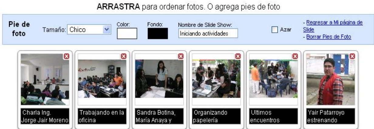
Figura 6. Opciones de pie de foto y borrar-ordenar fotografías.

Finalmente, en la parte de abajo encontrará unas últimas opciones relacionadas con generar un pie de foto, pudiendo elegir el tamaño, color de letra y fondo, nombre del Slide Show, si mostrarlas o no al azar, o si eliminar.