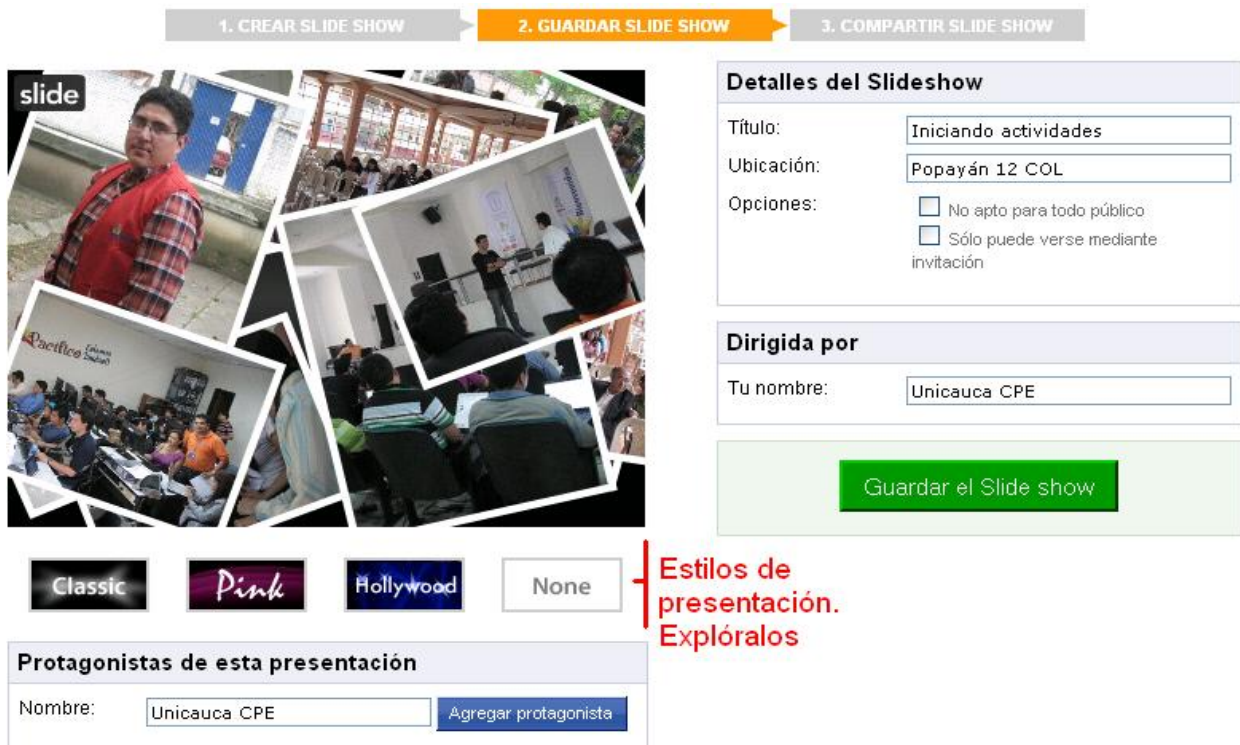
Figura 7. Guardar Slide show.