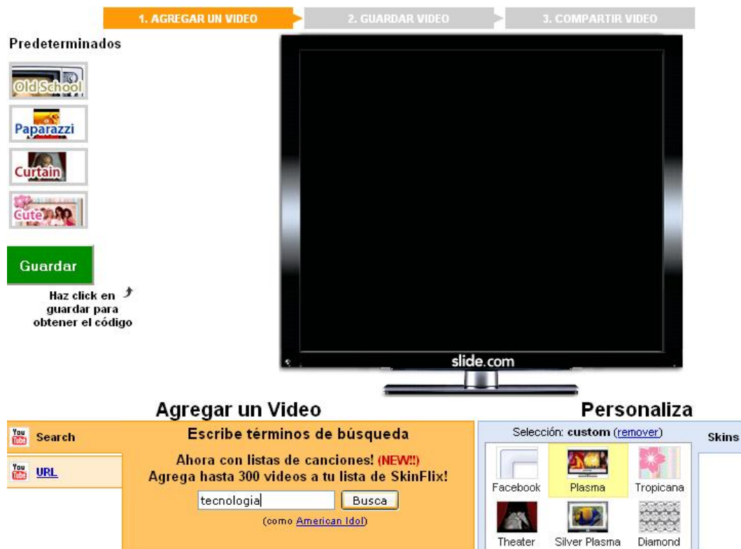
Figura 10. Agregar un video de YouTube con opción de búsqueda